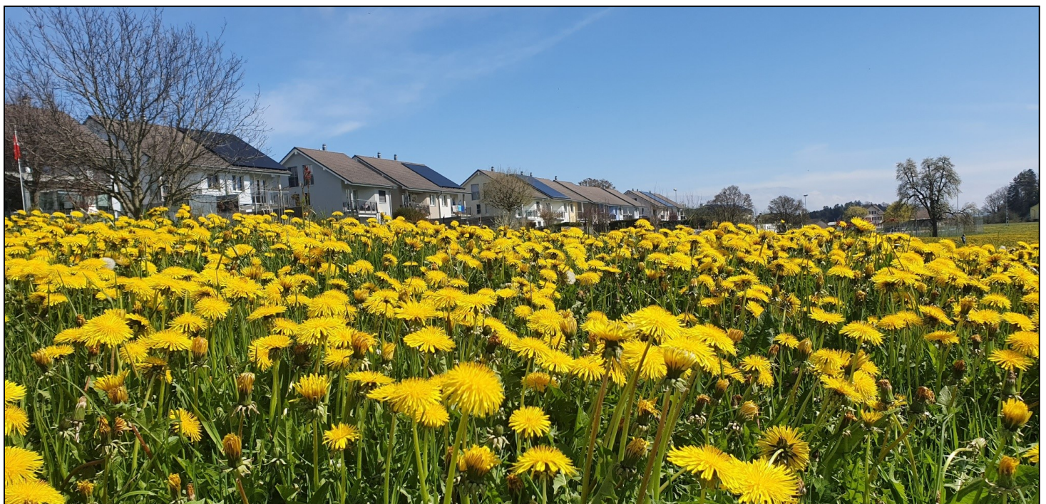
Blühender Löwenzahn vor der Kulisse des Wiesentalquartiers.